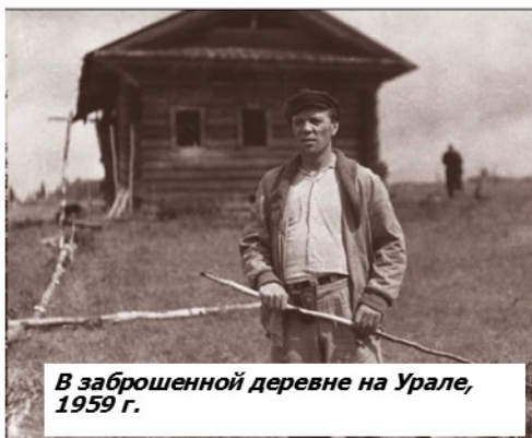
В заброшенной деревне на Урале, 1959 г.

В 1959 году была издана повесть «Стародуб», ставшая переломным моментом в творческой жизни Астафьева. События разворачиваются в старообрядческом сибирском поселении, спрятавшемся в дремучей тайге. В первую очередь это повесть о людях, о таежных законах, которые не вызывали у автора сочувствия.