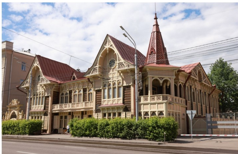
Литературный музей им. В.П. Астафьева, Красноярск