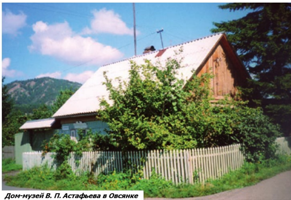
Дом-музей В. П. Астафьева в Овсянке

Виктор Петрович долго болел. Многочисленные хронические болезни и фронтовые ранения дали о себе знать. В апреле 2001 года Астафьев пережил первый инсульт, который повлек за собой паралич левой половины тела, второй инсульт настиг его в октябре, и с того времени он почти постоянно находился под наблюдением врачей. Третье по счёту кровоизлияние в мозг произошло в 3 часа ночи 29 ноября. Оно оказалось роковым.