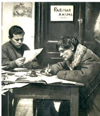
В редакции газеты «Гудок»