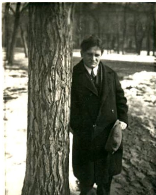
На Петровском бульваре, 1930.