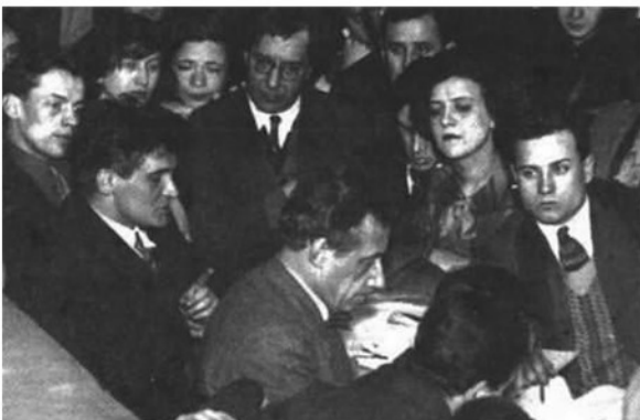
Ю. Олеша и Вс. Мейерхольд на читке пьесы в Гости- Ме. 1931

Когда Олеша впервые прочитал пьесу труппе, Мейерхольд сказал: «В вашей пьесе есть яд». Естественно, «яд» почувствовал не только Мейерхольд. Текст пьесы многократно переписывался – четыре варианта, бесконечные правки, любое сомнение запрещено, каждая мысль стара и буржуазна.