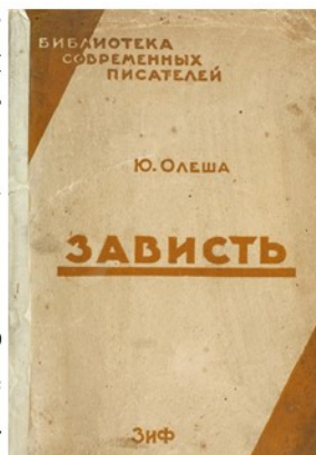
Обложка издания 1929 года

Роман «Зависть» прославил Олешу на весь мир. Два героя, не находящих себе место в новом социалистическом мире, организуют против него «заговор чувств». А рядом с ними живут здоровые люди, которые работают на благо человечества и рационально относятся к жизни.