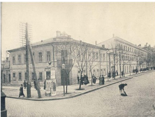
Ришельевская гимназия, 1910 год

Он умел восхищаться Андерсеном, Гофманом, Уэллсом, Твенном, Грином, а в последние годы Хемингуэем. Некоторое время его увлечением был Леонид Андреев, но оно недолго продолжалось. Олеша