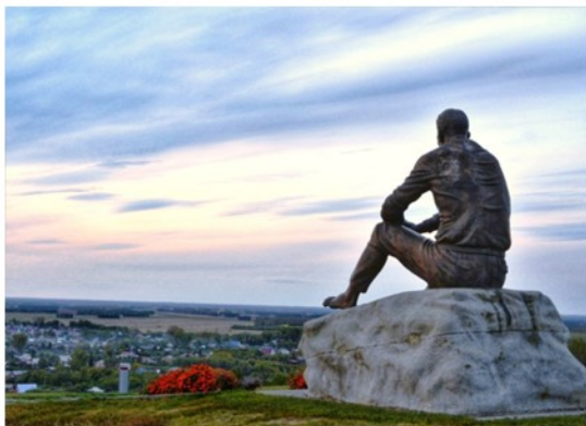
Памятник Шукшину в Сrostках