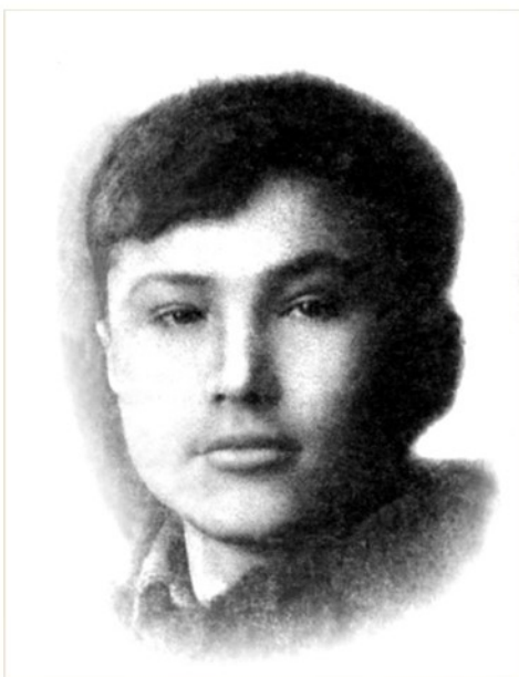
Василий Шукшин, учащийся автомобильного техникума