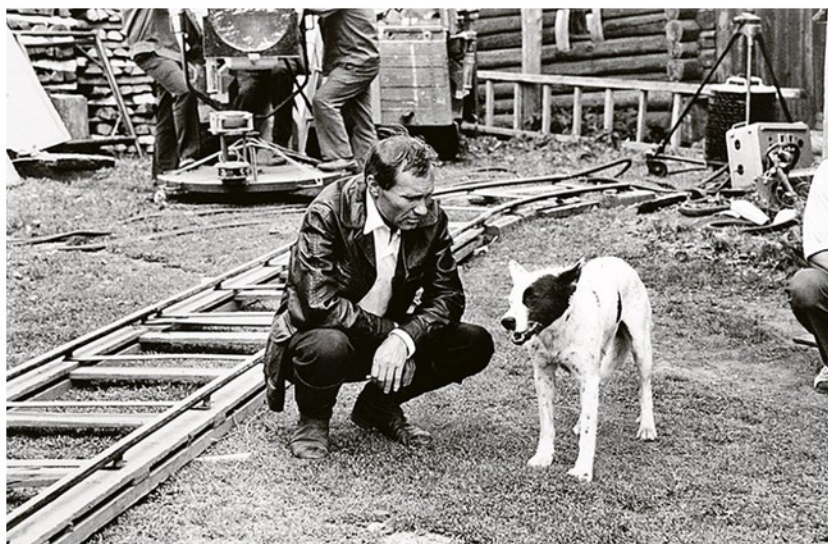
Василий Шукшин на съемках «Калины красной»

Часть съемок проходила в деревне Садовая Белозерского района Вологодской области (на момент съёмок деревня называлась Мериново). Из десяти домов деревни половина была задействована в съёмках. Жители вспоминали, что