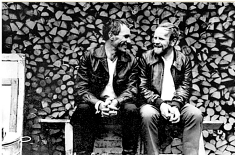
С писателем Василием Беловым. 1973 год