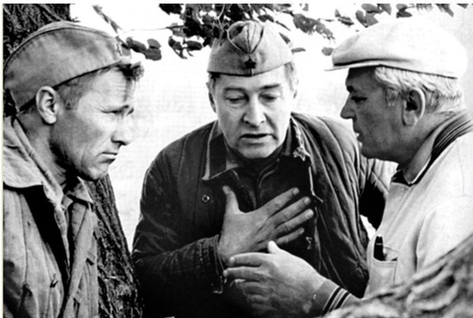
На съемках фильма «Они сражались за Родину». С Вячеславом Тихоновым и Сергеем Бондарчуком

«Главную заботу я бы проявил в раскрытии характера самого Разина – темперамент, свободолюбие, безудержная,