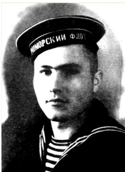
Шукшин, матрос Черноморского флота, 1952 год

Именно в Севастополе проявился его писательский талант. Бывшие сослуживцы-матросы хорошо помнят, как Василий Шукшин читал им свои рассказы «Двое на телеге» и «Разыгрались в поле кони». Все друзья по службе единодушно указывают на большой круг его интересов. Он с увлечением участвовал в художественной самодеятельности, создал драматический кружок и руководил им, писал для него театральные миниатюры, сценки; увлекался спортом, особенно боксом. Между тем про-