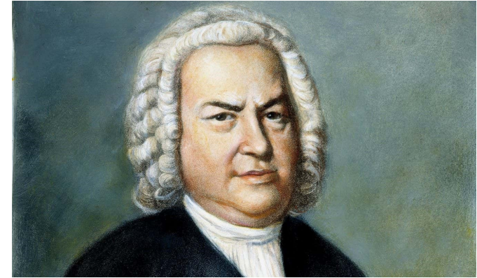
Иоганн Себастьян Бах (21 марта 1685 – 28 июля 1750)

Родился 21 марта 1685 года в Эйзенахе. Он был младшим из 8 детей в семье Иоганна Амброзиуса Баха и его жены Марии Элизабет Леммерхирт. Отец был организатором светских концертов и исполнителем церковной музыки.