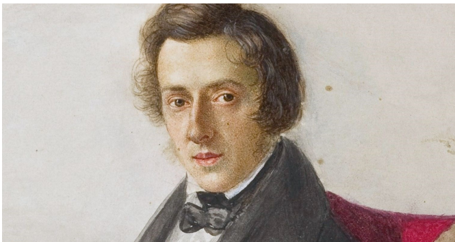
Фредерик Францишек Шопен (1 марта 1810 – 17 октября 1849)

Родился 1 марта 1810 года в деревне Желязова-Воля (Польша). С детства проявил выдающийся музыкальный талант: в 7 лет сочинил первое произведение, а в 8 лет впервые выступил публично.