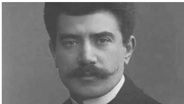
Рейнгольд (Эрнест) Морицевич Глиэр (11 января 1875 – 23 июня 1956)

Родился 30 декабря 1874 года (11 января 1875 по новому стилю) в Киеве в семье мастерового-немца. Окончил Московскую консерваторию (1900), где учился у С. Танеева (контрапункт) и М. Ипполитова-Иванова (композиция).