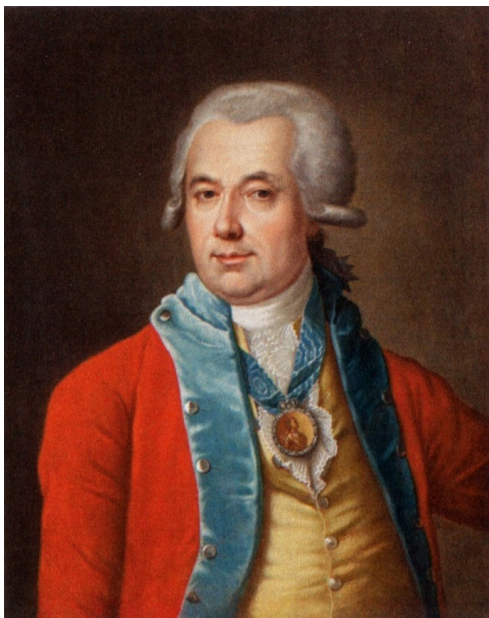
Портрет Григория Ивановича Шелихова 1790 - 1810-е гг.

В 1948 году вышла повесть «Шелихов на Кадьяке» (1948) – увлекательное повествование о путешествиях и приключениях российского исследователя, мореплавателя и купца Григория Шелихова, с 1775 года занимавшегося обустройством коммерческого торгового судоходства между Курильской и Алеутской островными грядами. В 1783–1786 годах Шелихов возглавлял экспедицию в Русскую Америку, в ходе которой были основаны первые русские поселения в Северной Америке.