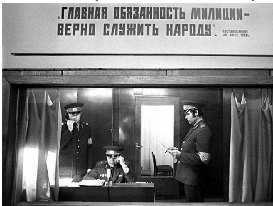
Дежурная часть милиции. Ленинград. 1970-е

Книги привлекают своей честностью, правдивостью в изложении событий, убеждённой солдатского правопорядка в чистоте, высокой нравственности и воспитательной роли