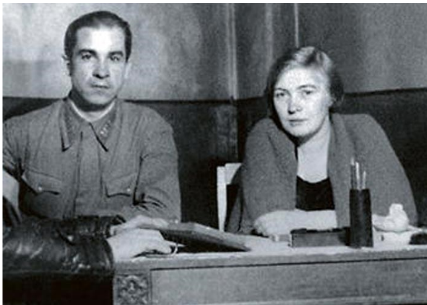
Ольга Берггольц с Георгием Макогоненко

Вера Кетлинская, руководившая в 1941 году ленинградским отделением Союза писателей, вспоминала, как в первые дни войны к ней пришла Ольга – «обаятельный