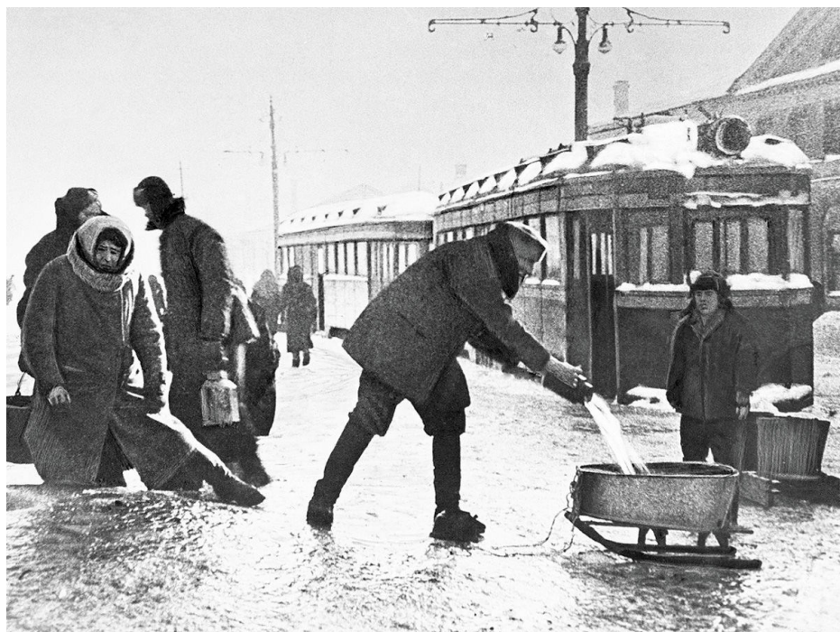
В блокадном Ленинграде

Товарищ, нам горькие выпали дни, Грозят небывалые беды, Но мы не забыты с тобой, не одни, – И это уже победа.