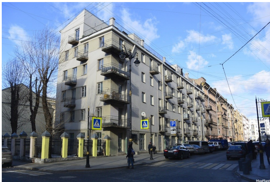
Дом-коммуна инженеров и писателей «Слеза социализма»

вая на 200 мест с кухонным блоком, а на крыше можно было играть, гулять и кататься на велосипеде. Санузлов в квартирах не было – они располагались по одному на этаже.