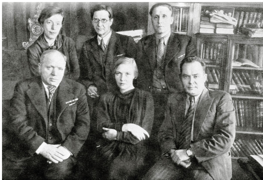
В редакции газеты «Известия». 9 апреля 1946 года. В первом ряду в середине – Ольга Берггольц

В 50-е Ольга Берггольц мечтает написать свою Главную книгу, которая, по ее мнению, «...должна начаться с самого детства, с первых страниц жизни и поэтому я поехала в город детства, в город счастливейшего сна... Возникла потребность начать сначала, с истоков сознания, с далекого, неувядающего прошлого – моего и моей страны» («Дневные звезды»).