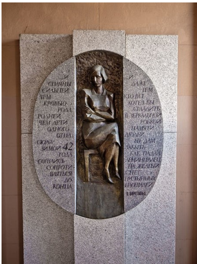
Мемориал Ольге Берггольц при входе в Ленинградский Дом Радио