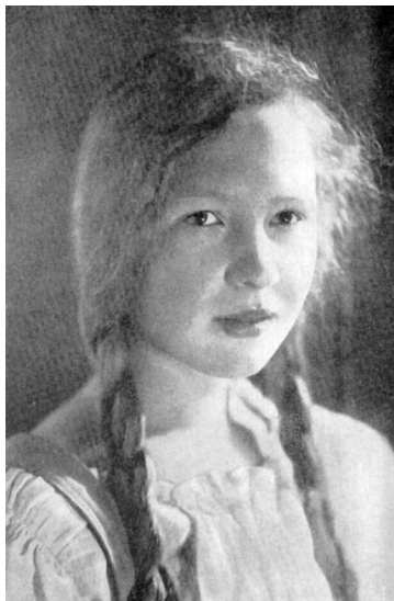
Ольга Берггольц в юности